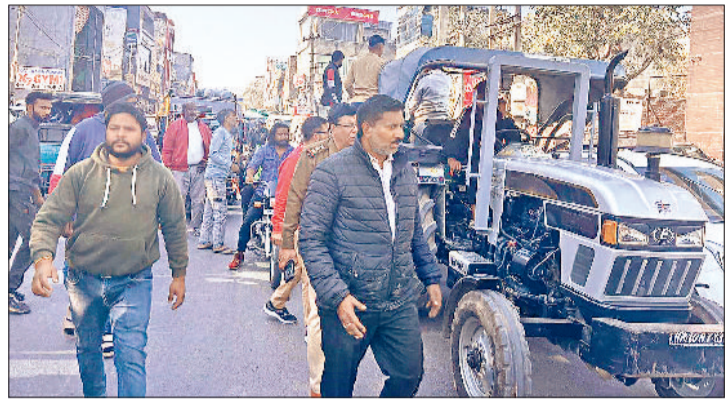
सोनीपत। अतिक्रमण हटवाते पुलिस कर्मी और निगम कर्मी।