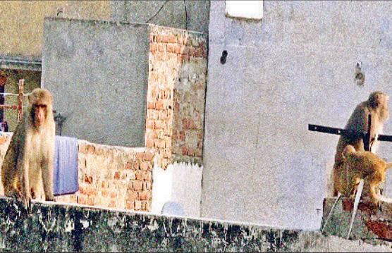
गन्नीर। शहर में मकान की दीवार पर बैठे बंदर।

काफ़ी समय से शहर में बंदरों के झुंड गलियों और बाजारों में मचा रहे उत्पात