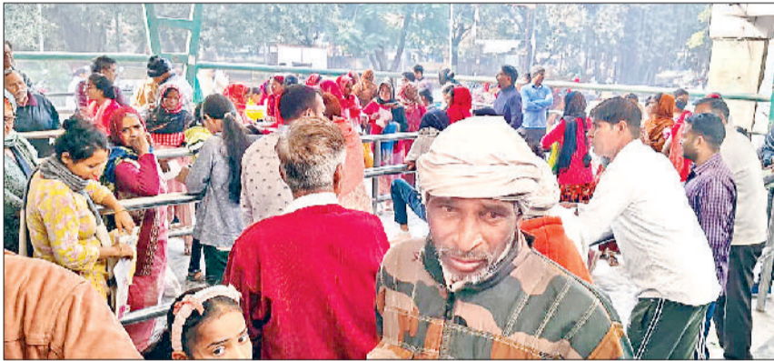
सोनीपत। नागरिक अस्पताल में लगी मरीजों की भीड़।

इस व्यापक विरोध प्रदर्शन ने सामान्य मरीजों, गर्भवती महिलाओं और आपातकालीन सेवाओं के लिए आने वाले लोगों को भारी मुश्किलों का सामना करने पर मजबूर कर दिया। वहीं, अब स्वास्थ्य विभाग के लिए बड़ी चुनौती चिकित्सकों की अनिश्चितकालीन हड़ताल की निपटाना होगा। क्योंकि अभी तक दो दिनों के लिए हड़ताल की कॉल की गई थी, लेकिन मंगलवार को हड़ताल को आगे बढ़ा दिया है। अब निगाहें स्वास्थ्य मंत्री आरती राव पर भी टिकी हैं कि वे किस तरह इस हड़ताल को खत्म करवाती हैं।